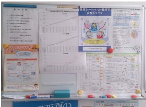
<エコアクション掲示板>