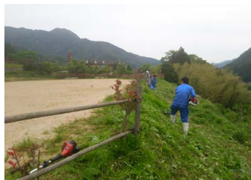
<地域清掃ボランティア>